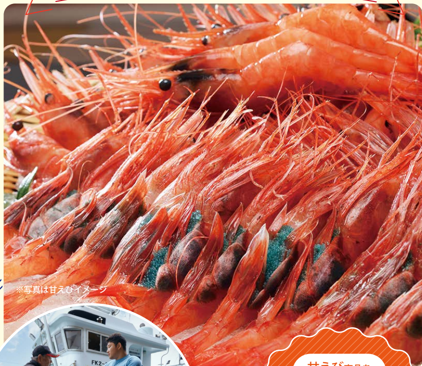
※写真は甘えのイメージ